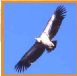
Bild links: markierter Gänsegeier