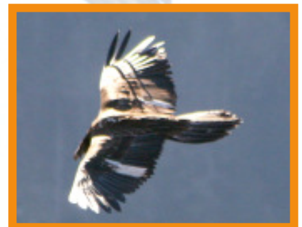
Jungvogel Calce, ein neuer Werbeträger für das Bartgeierprojekt.